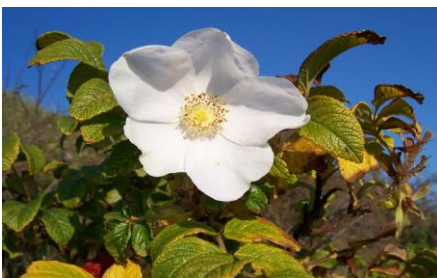
Abbildung 1: Aggressiver Neuankommeling: Die Kartoffel-Rose breitet sich besonders in Norddeutschland aus und führt zu artenärmeren Flächen.

Nicht heimische, invasive Arten können heimische Pflanzen- und Tierarten verdrängen und tragen deshalb zum Verlust der biologischen Vielfalt bei. So wandert z.B. die Robinie in brachfallenden Halbtrockenrasen ein und reichert Stickstoff im Boden an, wodurch weitere Arten begünstigt werden, die die natürliche Vegetation des Halbtrockenrasens verdrängen. Grundsätzlich sollten bei der Grüngestaltung nur heimische Pflanzenarten verwendet werden. Sie sind Nahrungsquelle für Vögel, Insekten und Kleinsäugetiere und an die klimatischen Bedingungen angepasst (was auch die Unterhaltskosten senkt). Exotische Arten, die aufgrund ihrer Attraktivität auf naturfernen Flächen angepflanzt werden, dürfen keine Chance haben, sich von selbst zu verbreiten.