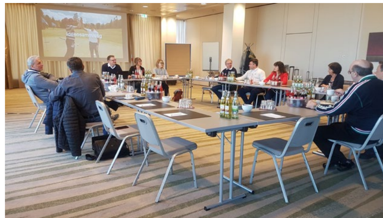
Club-Workshop in Nürnberg

An den Workshops nahmen Vertreterinnen und Vertreter von 80 Golfanlagen teil. Es wurden zahlreiche konkrete Maßnahmen zur Zusammenarbeit vereinbart. Das Feedback der teilnehmenden Clubs war ausschließlich positiv. Vielen Golfanlagen war nicht bewusst, dass die VcG mit ihrer Abteilung Clubservice umfassende Kommunikationsmöglichkeiten anbietet, die für die Anlagen stets kostenfrei auf zahlreichen Wegen ausgeliefert werden können. Aus den Erfahrungen dieser Workshops wird die VcG künftig ihr Angebot für lokale Golfanlagen noch stärker in den Fokus ihrer Arbeit setzen.