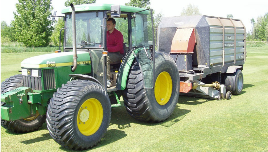
Lärmbelastung durch Golfplatzpflege

Grundlage einer rechtlichen Beurteilung ist sowohl Bundesrecht als auch Landesrecht. Seit September 2002 gilt die „Verordnung zur Einführung der Geräte- und Maschinenlärmschutzverordnung“.