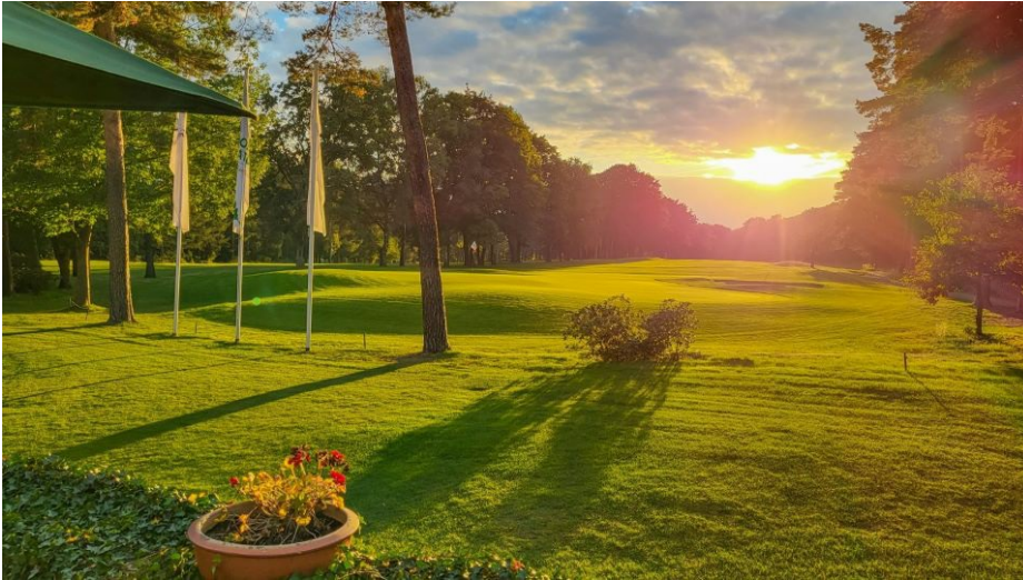
Der GC Hannover richtet im Jahr seines 100. Geburtstages zum ersten Mal eine Deutsche Lochspielmeisterschaft aus.