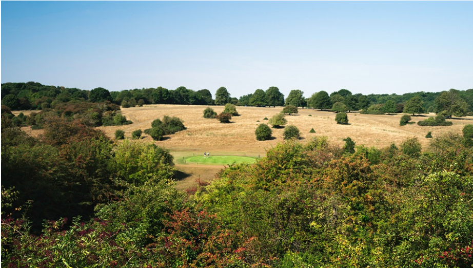
Ein wichtiges Thema: Die Bewässerung von Golfplätzen

Neben den bereits vorhandenen Fachinformationen hat der DGV für seine Mitglieder jetzt Kommunikations- und Argumentationshilfen zur Bewässerung von Golfplätzen erstellt. Diese unterstützen Sie dabei, auf Anfragen schnell und fundiert zu reagieren,