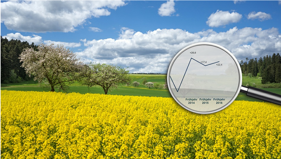
Ergebnisse zum Frühjahresbarometer des DGV

Kennen Sie die derzeitige Stimmung in Ihrer Golfregion? Wissen Sie, wie sich die Preise bei vergleichbaren Golfanlagen entwickeln? Diese und weitere Ergebnisse lesen Sie im Golfbarometer Frühjahr 2018, das der DGV in Zusammenarbeit mit der IFH Köln GmbH erstellt hat. Die an der Befragung teilnehmenden Golfanlagen erhalten dabei einen erheblichen Mehrwert.