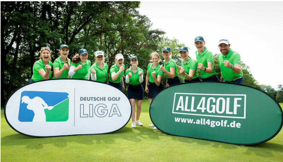
Überraschung in Frankfurt -Die Damen des Stuttgarter GC Solitude gewinnen Spieltag zwei vor Meister St. Leon-Rot