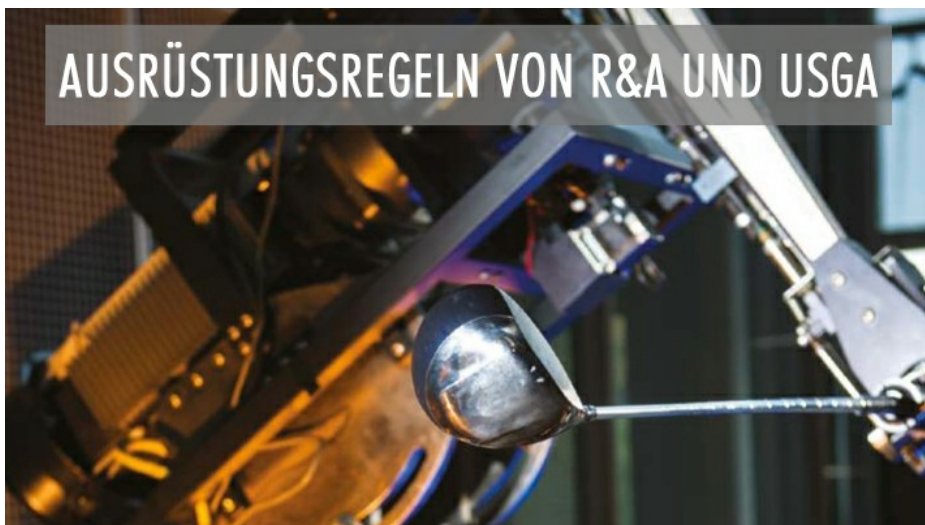
Die neuen Ausrüstungsregeln des R&A und der USGA

Der DGV hat die Equipment-Rules des R&A und der USGA ins Deutsche übersetzt. Die sogenannten Ausrüstungsregeln sind im DGV-Serviceportal abrufbar.