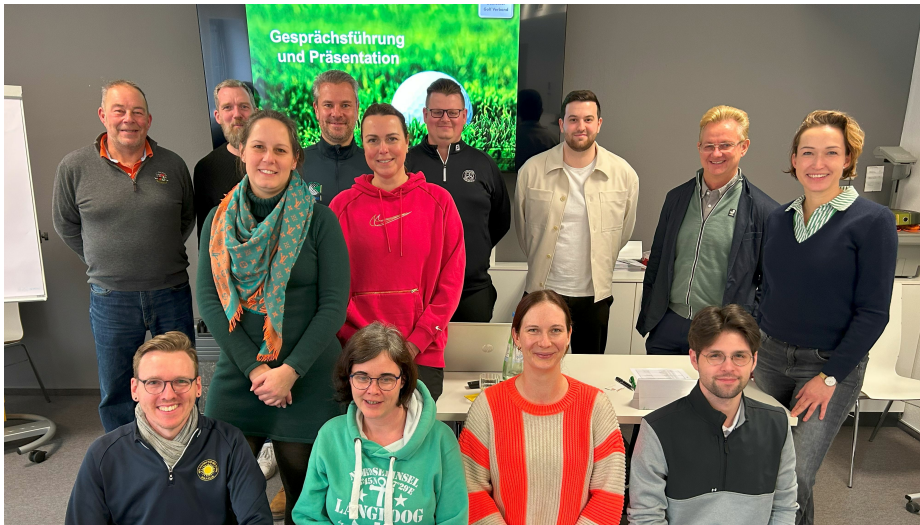
DGV-Golfbetriebswirte Jahrgang 2024/2025

Vom 17. bis 21. Februar 2025 fand an der Sportschule Hennef bei Bonn das dritte und somit abschließende Modul der Ausbildung zum DGV-Golfbetriebswirt statt. 13 Teilnehmende tauchten im aktuellen Jahrgang in die Welt des modernen Golfmanagements ein und erweiterten ihr Fachwissen in zentralen Bereichen.