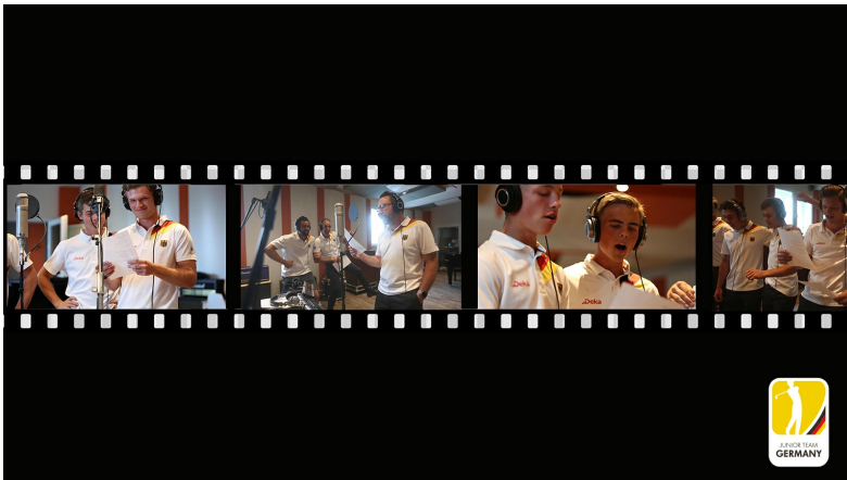
Der EMM-Song des Junior Team Germany ist da! "Golf is our Religion!"