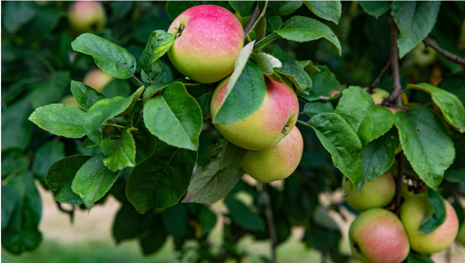
Auf dem Achimer Golfplatz zahlreich zu finden: Apfelbäume.