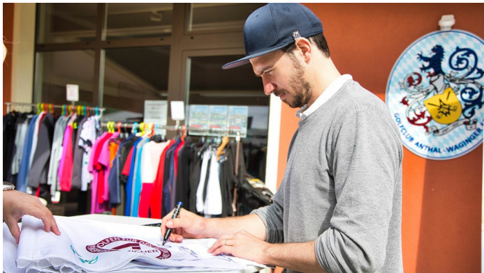
Felix Neureuther bei der Autogrammstunde