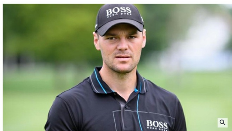
Martin Kaymer sammelt Spenden im Kampf gegen die Corona-Krise.

Deutschlands Top-Golfer Martin Kaymer hat im Kampf gegen die Coronavirus-Pandemie eine Spendenaktion gestartet und bereits 50.000 Euro als Startkapital zugesagt.