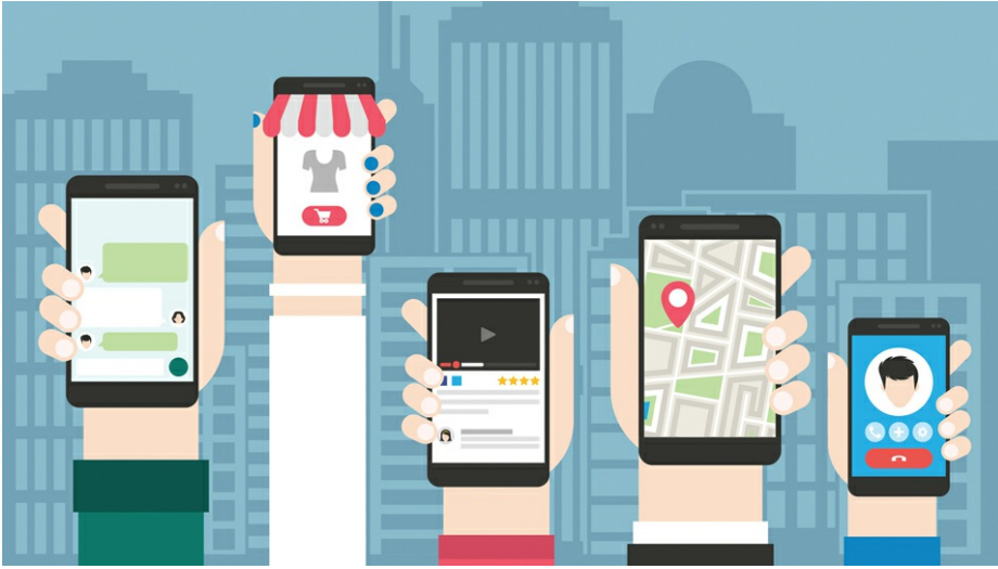
Einbetten, Reposten und Teilen auf der Club-Homepage und den Social-Media-Kanälen

Dieser Tage sind Ihre Social-Media-Kanäle sowie Ihre Club-Homepage wichtige Plattformen, um mit Ihren Mitgliedern in Kontakt zu treten, sie zu informieren, zu sensibilisieren, um Verständnis zu appellieren, aufzuklären, aber vielleicht auch um zu unterhalten und abzulenken. Wir präsentieren Ihnen hier, wie u.a. einige DGV-Mitglieder aktuell kommunizieren (nur eine Auswahl) und möchten Ihnen an dieser Stelle zudem eine kleine Anleitung zur Verfügung stellen, interessanten Content auf Ihren Seiten zu teilen, zu reposten oder auf Ihrer Homepage einzubetten.