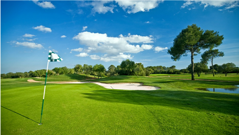
Absage der Golf-Erlebniswoche 2021

Die bundesweite Golf-Erlebniswoche für das Jahr 2021 wird abgesagt und das Werbebudget für andere Maßnahmen zur Gewinnung neuer Golfinteressenten eingesetzt.