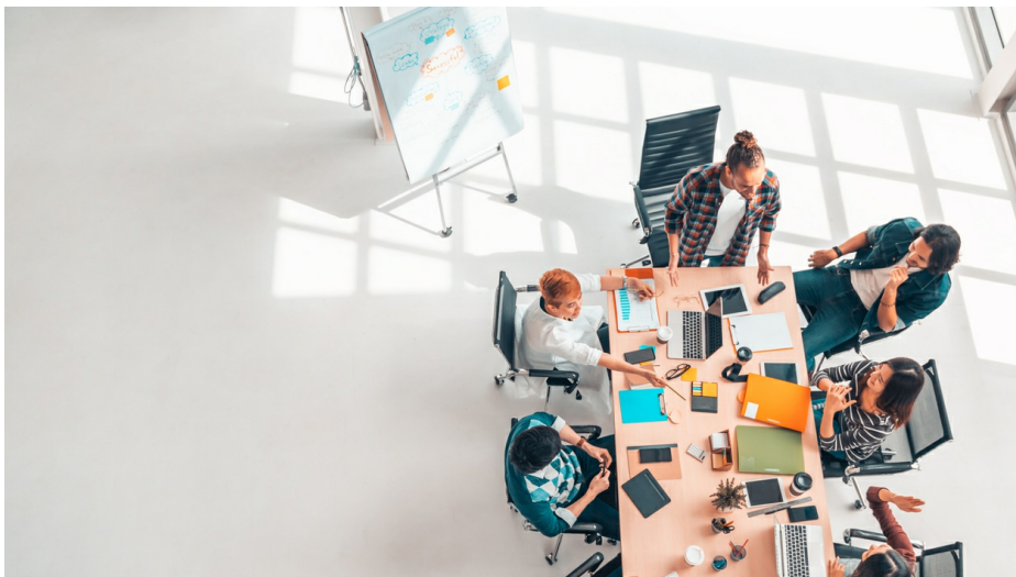
Ein intensiver persönlicher Austausch - ein Kennzeichen der DGV-Ausbildungsgänge

Im November 2021 beginnt der neue Seminarzyklus der Aus- und Weiterbildung des DGV. Interessierte können sich jetzt für die konzeptionell überarbeiteten Golfmanagement-Seminare anmelden.